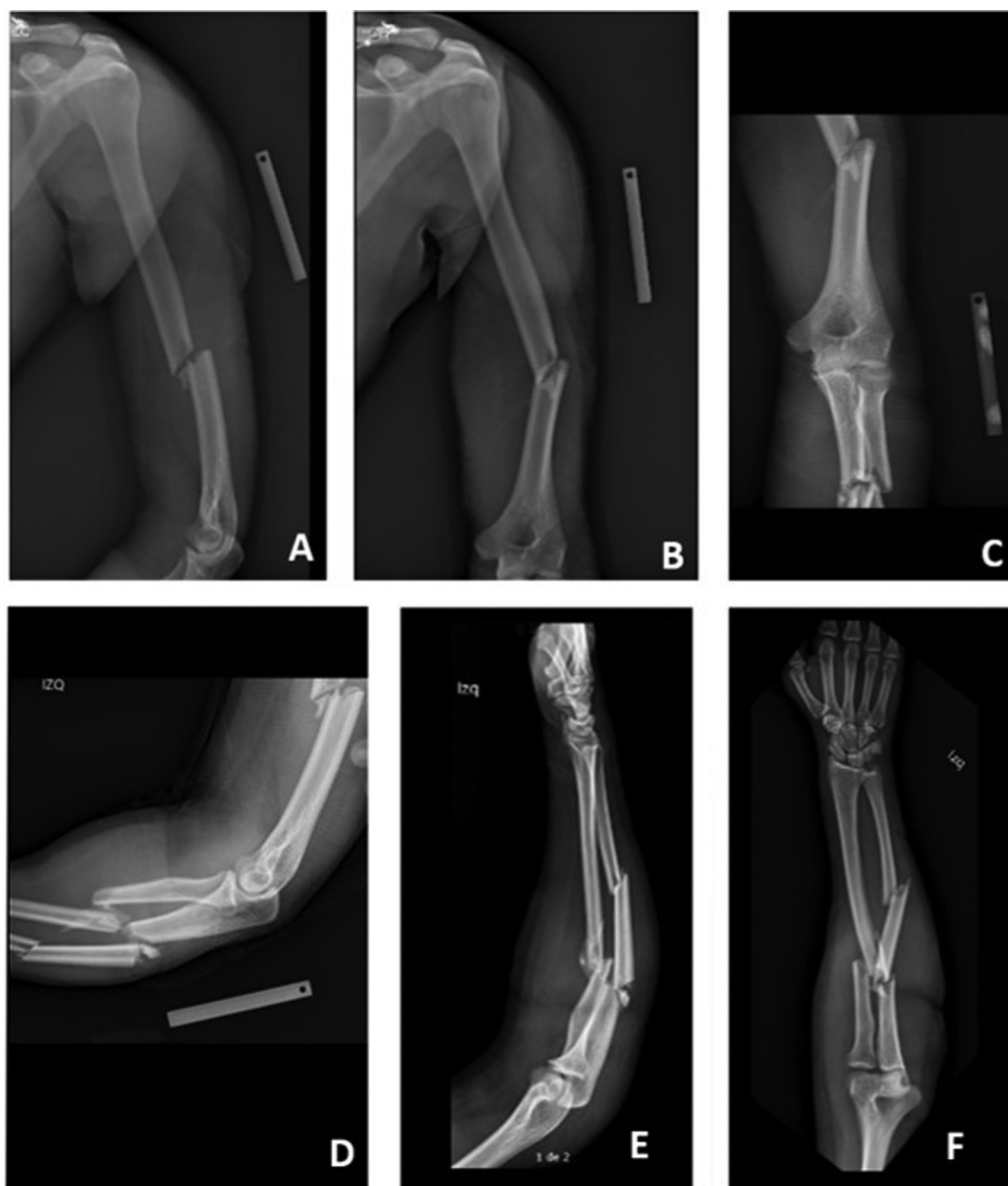
Fig. 1 Exame radiológico inicial do braço e antebraço. A fratura diafisária do úmero é observada nos planos lateral (A) e ântero-posterior (B). Radiografias do cotovelo mostrando a relação entre as fraturas do úmero e do antebraço nos planos ântero-posterior (C) e lateral (D). Fratura segmentar da ulna e fratura do terço proximal do rádio, nos planos lateral (E) e ântero-posterior (F).

Paciente do sexo masculino, 19 anos, deu entrada no pronto-socorro apresentando lesões após acidente de trânsito. Ele dirigia um veículo que colidiu em alta velocidade contra um caminhão de carga. Na avaliação inicial foram documentados traumatismo cranioencefálico grave (Glasgow 6/15) e múltiplas deformidades em membro superior esquerdo.