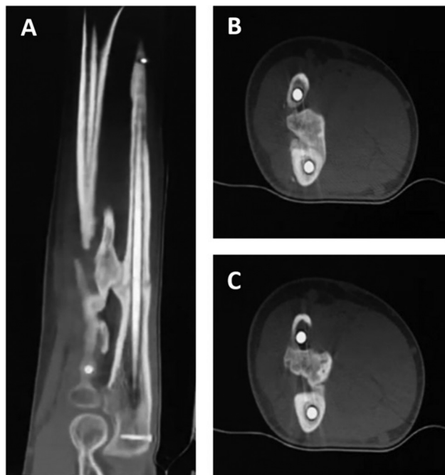
Fig. 4 Imagens de tomografia computadorizada mostrando sinostose radioulnar na junção do terço médio com o terço proximal da diáfise. Cortes sagitais (A), cortes axiais (B, C).

Este relato de caso foi aprovado pelo comitê de ética sob número CEI-115 - Acta 359 em 28 de abril de 2023, e o