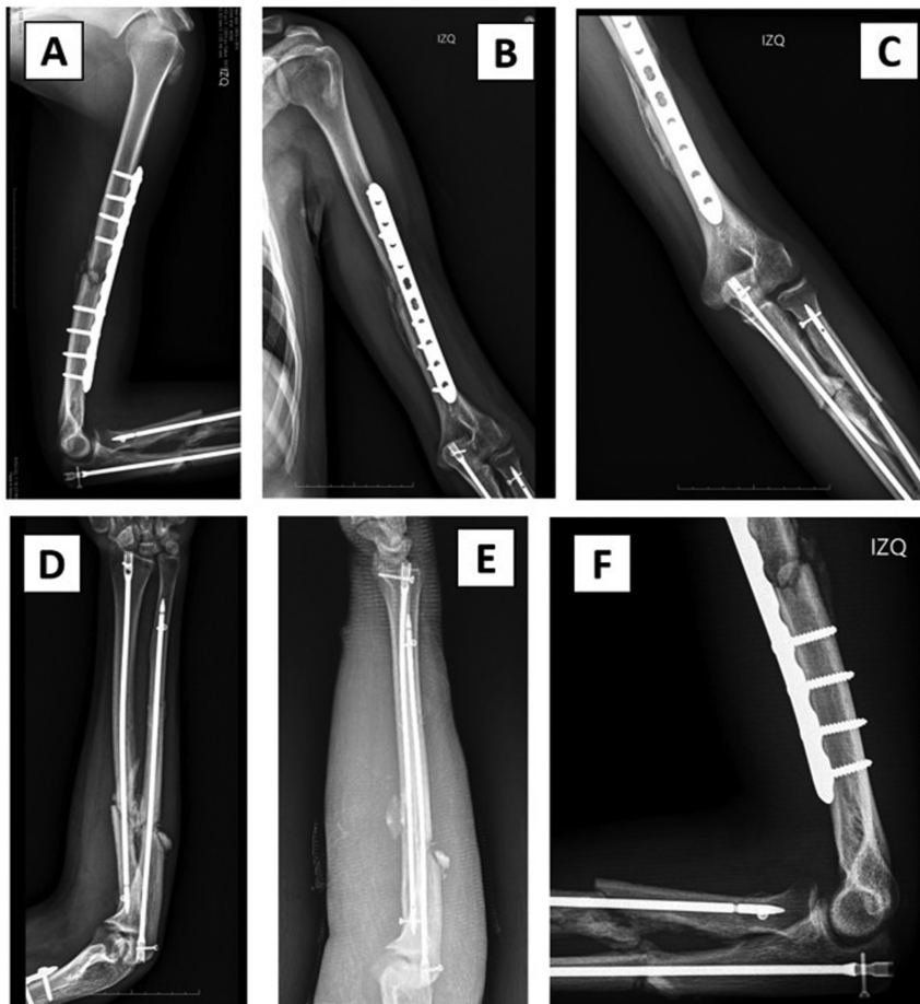
Fig. 3 Radiografias pós-operatórias. A fixação no úmero com a placa LG-DCP é observada nos planos lateral (A) e ântero-posterior (B). Radiografias do cotovelo mostrando restauração adequada da relação entre fraturas do úmero e do antebraço nos planos ântero-posterior (C) e lateral (F). Estabilização de fraturas de rádio e ulna com hastes intramedulares nos planos anteroposterior (F) e lateral (E).